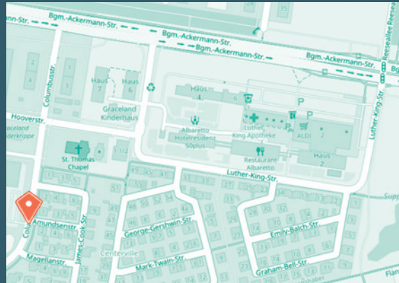
Sporthalle Centerville, Columbusstraße 70

Centerville, Cramerton, Sullivan-Heights, sind die ehemaligen amerikanischen Wohnsiedlungen, die es in Augsburg Kriegshaber von 1945 - 1998 gab.